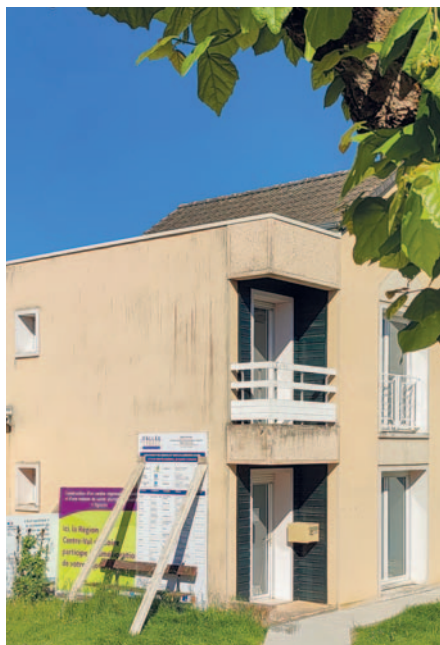
Futurs Maison de santé et Centre Régional de Santé d'Eguzon.

Pour le bassin de vie d'Argenton, il s'agit de conforter la Maison de Santé Pluridisciplinaire avec un objectif minimal de huit médecins libéraux. Afin de se donner toutes les chances de permettre l'accès de toute la popu-