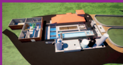
Usine d'eau potable de la Grave (vue 3D)

L'usine de traitement de la Grave : une technologie complexe au service de la qualité de l'eau