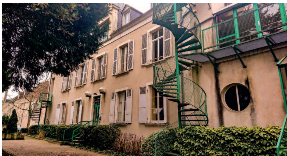
La façade arrière de la mairie.