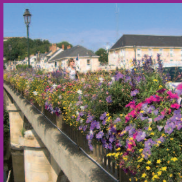
Le fleurissement du Pont neuf primé par le Conseil Départemental