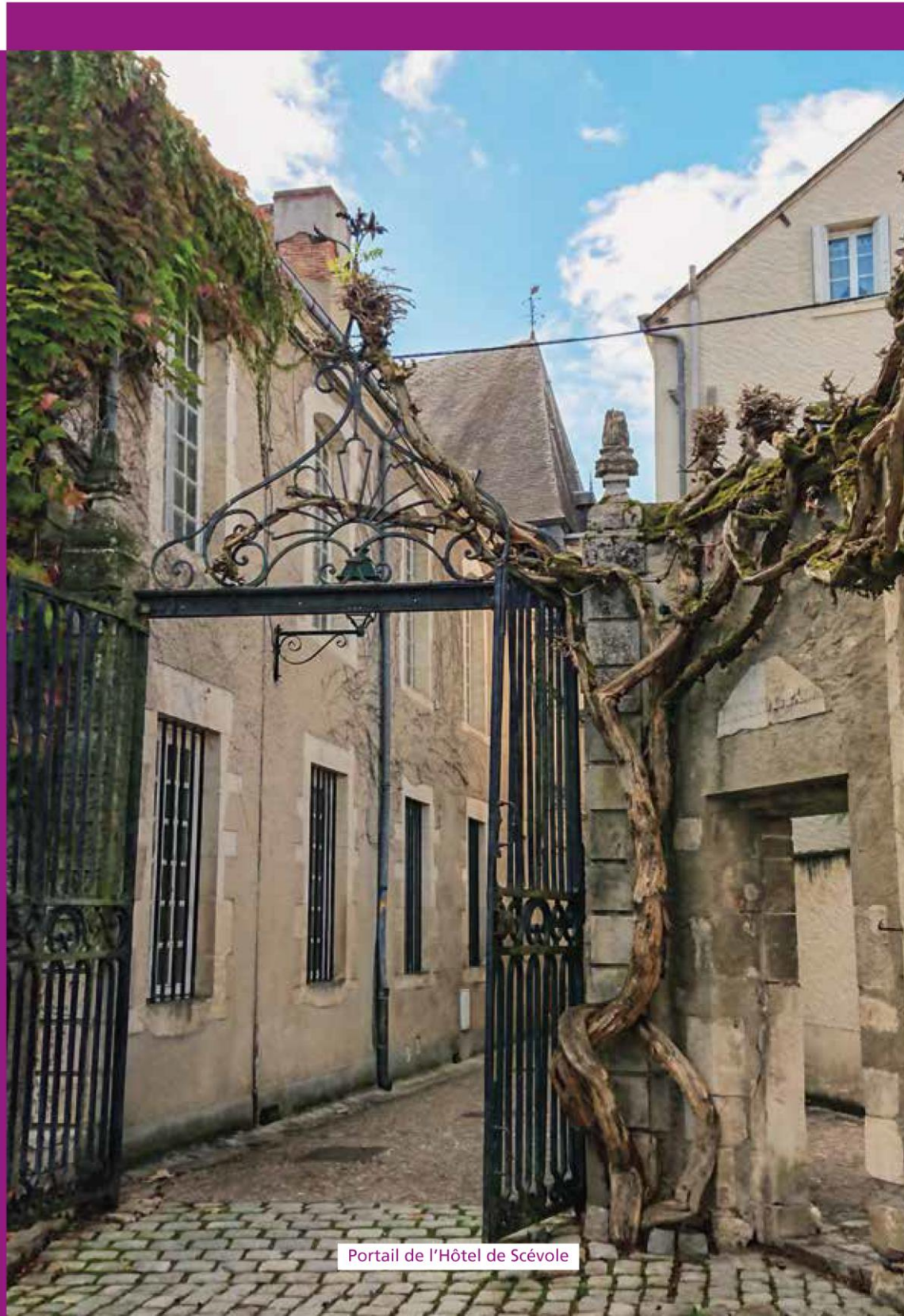
Portail de l'Hôtel de Scévole