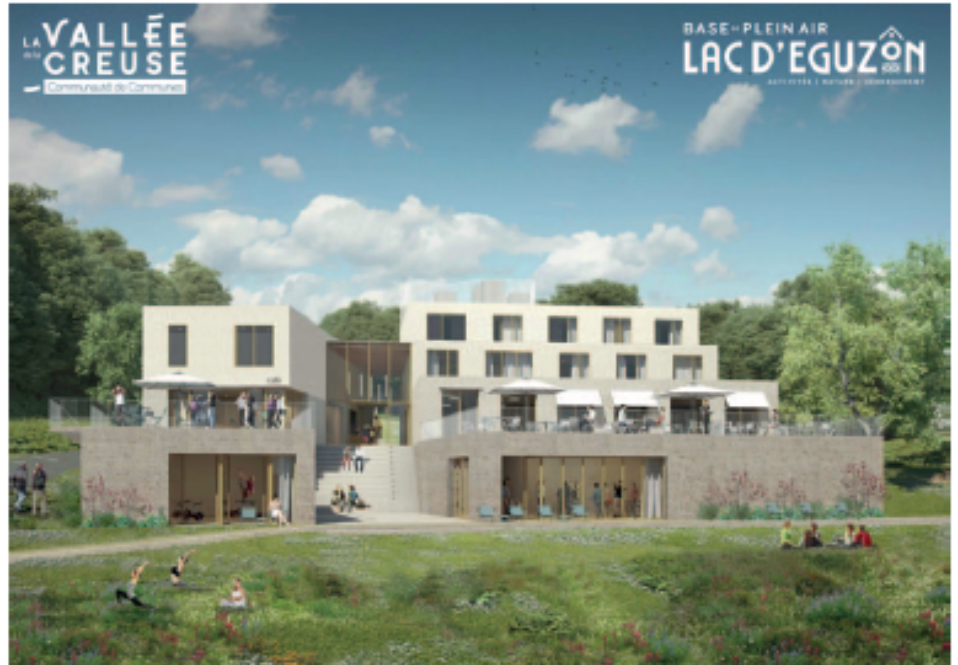
Vue extérieure côté lac du pôle hébergement de la base de plein air Lac Eguzon

Sur le même site, la base de plein air propose un panel d'activités variées incluant des activités nautiques (voile, planche à voile, paddle, canoë, pédalo etc.) et terrestres (tir à l'arc, escalade, VTT, etc.). Il est possible de louer du