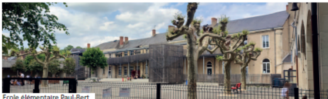
Ecole élémentaire Paul-Bert

Si vous souhaitez de plus amples informations ou si vous avez des questions, des remarques ou des suggestions, n'hésitez pas à prendre contact avec les services de la mairie et les élu.e.s en charge de ces questions.