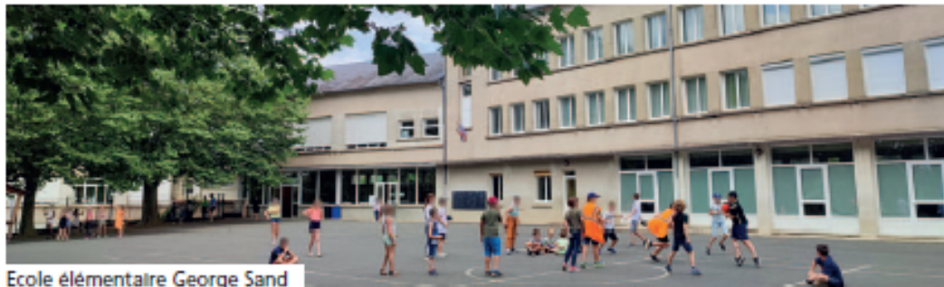
Ecole élémentaire George Sand