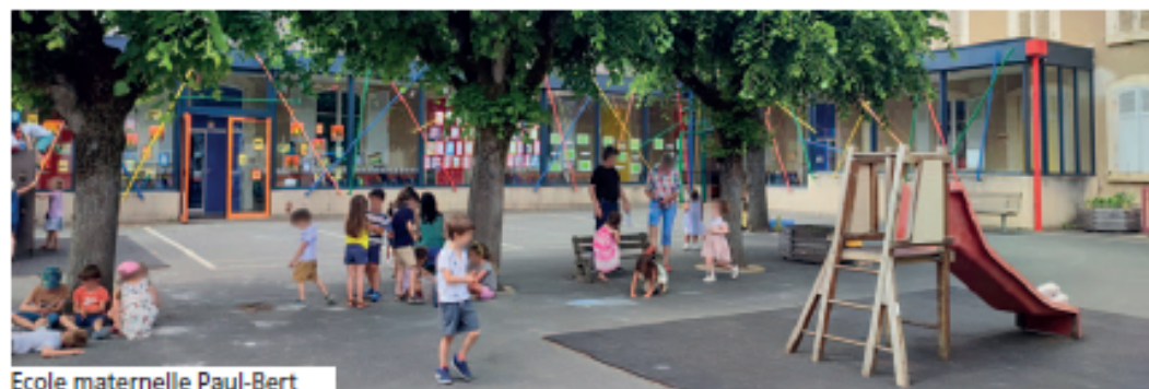
Ecole maternelle Paul-Bert

Depuis les vacances d'automne 2020, la mairie n'a eu de cesse d'élargir son offre d'accueil de loisirs. En créant une offre pour les 3-6 ans pendant les petites vacances scolaires, en complément de celle existante les mercredis, et en accueillant à compter de juillet 2022 les 3-12 ans en journée complète au groupe scolaire Paul Bert, tous les enfants et jeunes entre 3 et 17 ans peuvent désormais profiter des centres de loisirs de la commune.