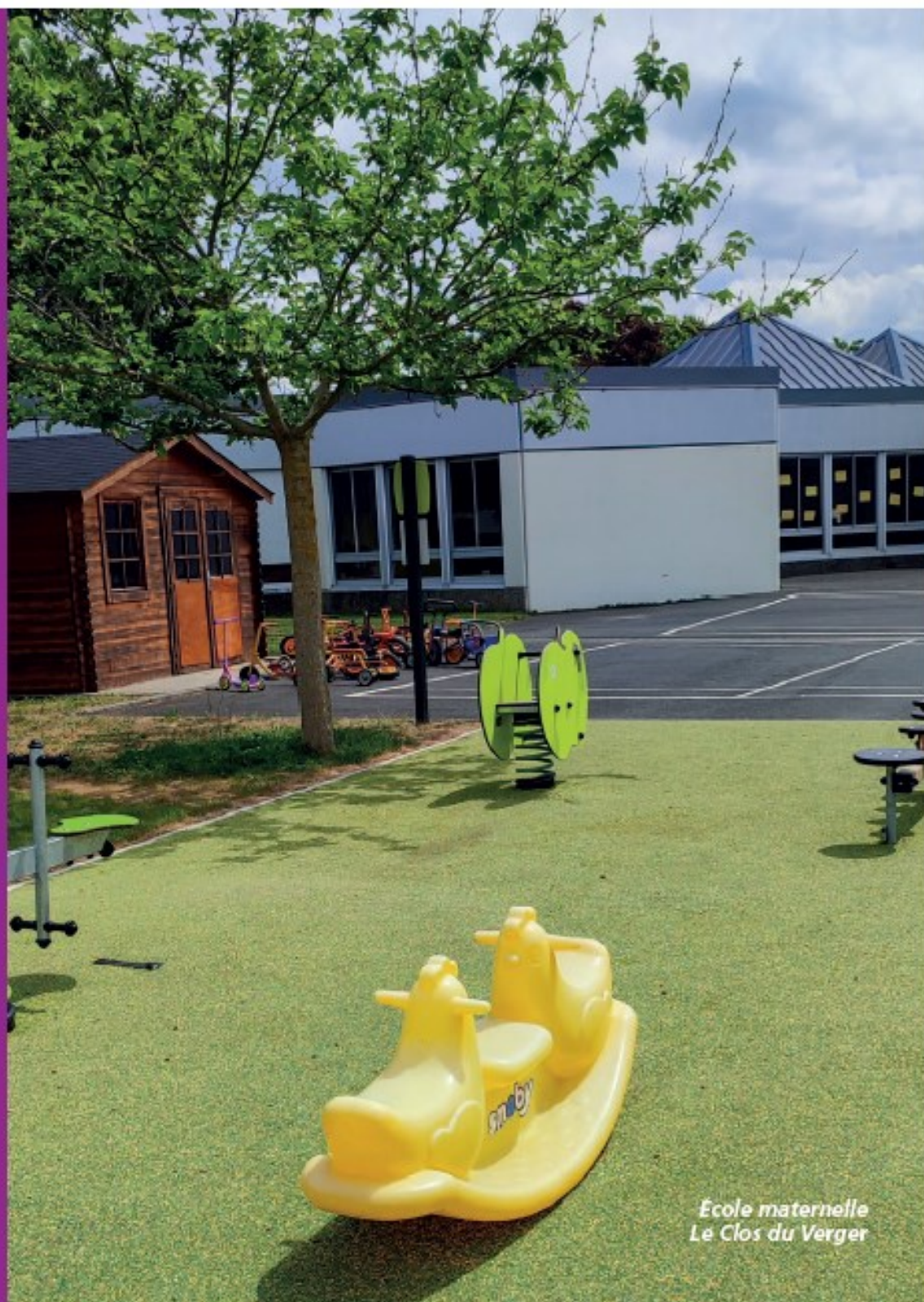
Ecole maternelle Le Clos du Verger