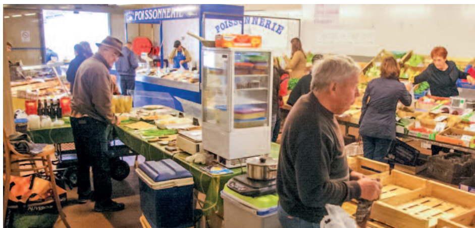
Allée du marché en fin de matinée.

Entièrement rénové de septembre 2007 à juin 2008, il se définit avant tout comme un marché alimentaire. Parfois bio, le plus souvent du terroir, les produits proposés à la vente sont