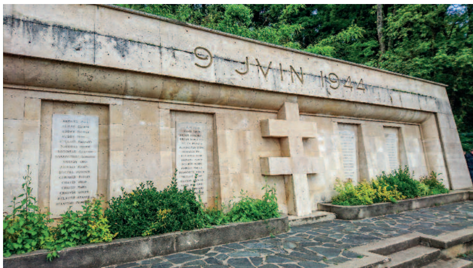
Mémorial du 9 juin 1944 érigé en 1947.

Chaque année, le 9 juin, une cérémonie de commémoration du massacre d'Argenton a lieu au Mémorial. Le rassemblement a lieu place de la République, il est suivi d'une montée au mémorial, de la lecture des noms des victimes par des élèves du collège et du lycée Rollinat, puis d'un vin d'honneur salle Charles Brillaud.