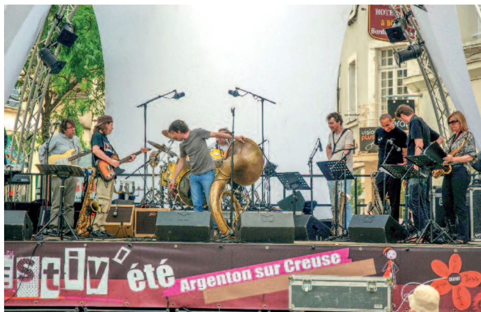
Répétition pour le concert du soir sur la Place de la République.

Une fanfare surprenante animera également la place de la République le samedi matin.