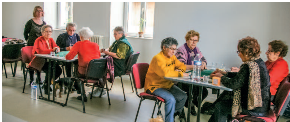
Après-midi au foyer des Anciens.

Dans le cadre de sa politique d'action sociale, le centre communal d'action sociale, service de proximité par définition, a toujours été dans toutes ses