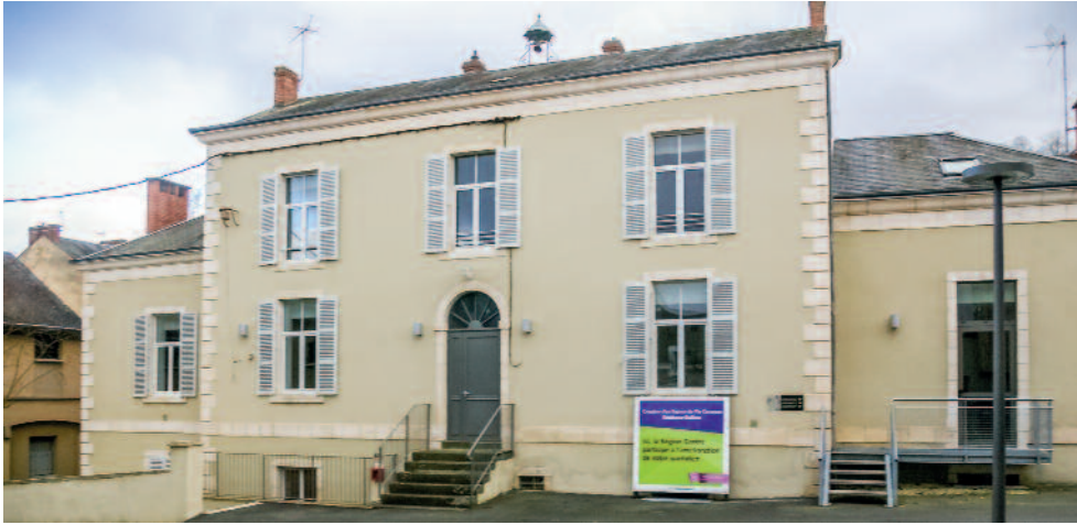
Locaux du pôle séniors inaugurée en 2013.

actions au service de nos concitoyens. Diversifiant ses interventions et le public bénéficiaire, le CCAS œuvre tant pour les familles que pour les aînés de la ville.