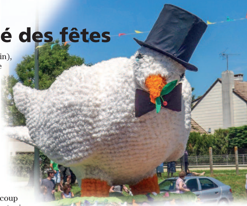
Char du Merle Blanc lors de la cavalcade.

Dernière association de quartier d'Argenton, les Amis du Merle Blanc vous invitent dans le «nid du Merle» pour préparer les festivités des 17, 18, 19