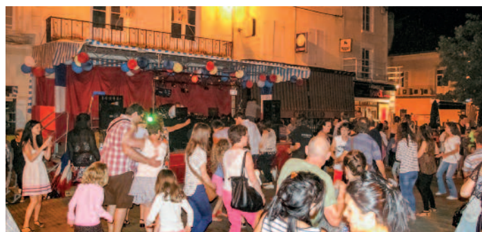
Bal populaire organisé sur la Place de la République.

23h00 Grand feu d'artifice en musique suivi d'un bal place de la République animé par la formation Romain Theret (5 musiciens, 1 chanteuse)