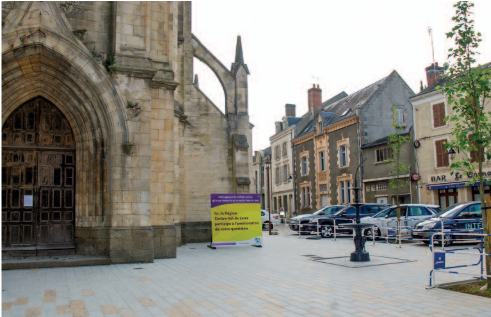
Le nouveau parvis de l'église Saint-Sauveur

2015 zone de rencontre (voir encadré sur les règles à adopter), la vitesse a été réduite à 20 km/h pour garantir la sécurité des piétons et favoriser la déambulation devant les magasins. La priorité est donc donnée aux piétons pour promouvoir l'esprit convivial qui caractérise tant ces rues.