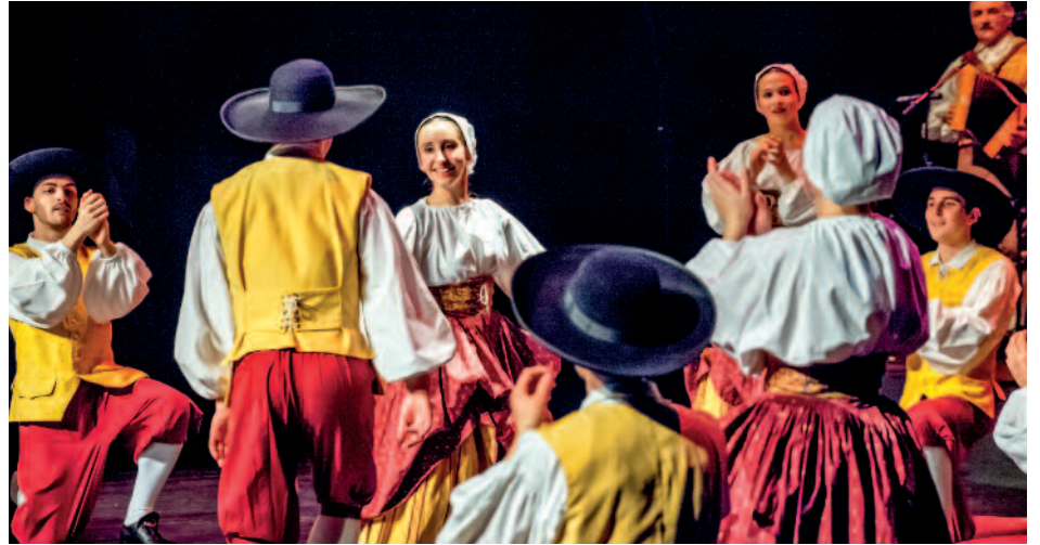
Danse des Joyeux Vendéens à l'affiche en 2016.

Cette année, le festival présentera ainsi les arts traditions populaires de trois pays : la Côte d'Ivoire, le Kirghizstan, pays d'Asie Centrale situé près de la Chine, et le Tatarstan, République de la fédération de Russie, situé sur les bords de la Volga. Deux groupes français seront également présents : l'un de Vendée, et le second