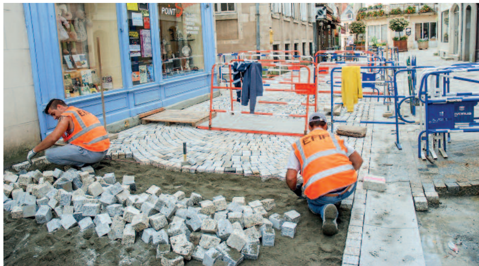
La pose des derniers pavés dans la rue Grande.

Outre l'embellissement du centre-ville d'Argenton, les travaux modifient les usages en soutenant une nouvelle cohabitation des piétons, des vélos et des véhicules. Ces rues sont désormais un espace partagé. En les classant dès l'été