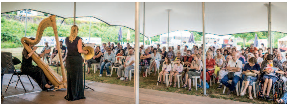
Scène des concerts gratuits de l'après-midi dans les jardins de la Grenouille.